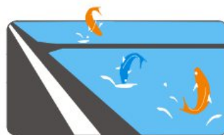
海水养殖循环过滤 Mariculture circulation filter