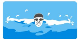
泳池循环过滤 Recirculation of water in swimming pool equipment